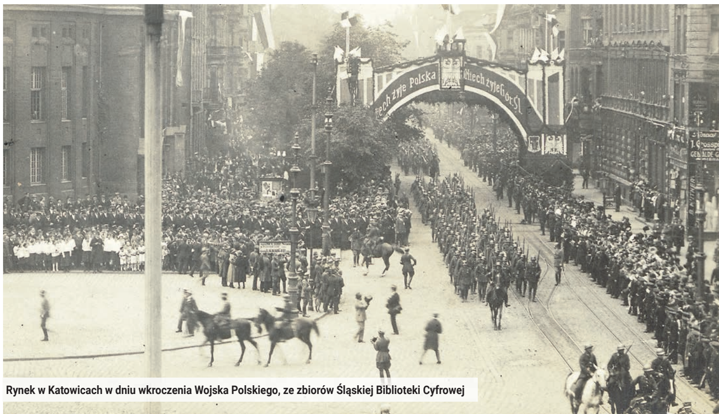
Rynek w Katowicach w dniu wkroczenia Wojska Polskiego, ze zbiorów Śląskiej Biblioteki Cyfrowej

W czerwcu minie sto lat od wkroczenia Wojska Polskiego do Katowic. Po trzech powstaniach i plebiscycie rozpoczęło się formalne przejście przez Polskę władzy na przyznanej jej części Górnego Śląska. Miasto uczci tę rocznicę 18 i 19 czerwca. Dokładnie 20 czerwca 1922 roku gen. Stanisław Szepetycki wjechał na czele swoich oddziałów na katowicki Rynek od strony Szopienic, radośnie witany przez mieszkańców i władze. Zwieńczeniem tego symbolicznego wydarzenia było podpisanie przez rząd Rzeczypospolitej Polskiej niespełna miesiąc później, bo 16 lipca, Aktu Objęcia Górnego Śląska.