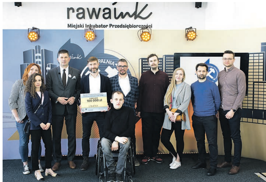
Katowickie startupy miały szansę sprawdzić się w wyzwaniu postawionym przez miasto i zaważczyć o spore pieniądze, które pozwolą wdrożyć ich pomysły w życie

W ciągu najbliższych trzech lat wszystkie usługi realizowane w terenie będą wymagały cyfrowego planowania, weryfikowania