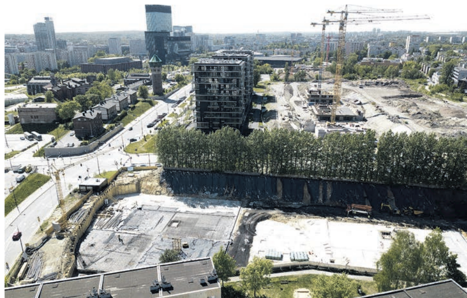
Budowa osiedli przy Strefie Kultury