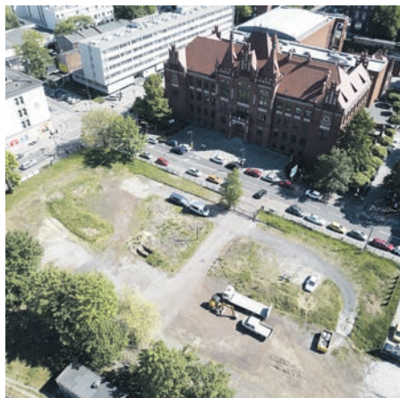
Teren inwestycji Akademii Muzycznej