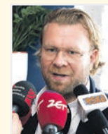
MACIEJ KAWULSKI REŻYSER „AKADEMII PANA KLEKSA”

To jest spełnienie moich marzeń. Chcemy, żeby ten Kleks stał się międzynarodowy. Gdyby Jan Brzechwa urodził się w Londynie, a J.K. Rowling w Warszawie, to ta historia mogłaby się zupełnie inaczej potoczyć. Do dzisiaj wszystkie dzieci za wzór do naśladowania mogłyby uważać Ambrożego Kleksa, a nie Harry Pottera.