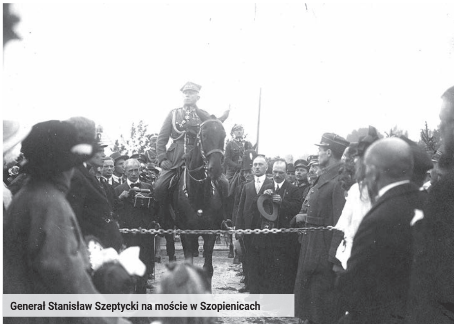
Generał Stanisław Szeptycki na moście w Szopienicach