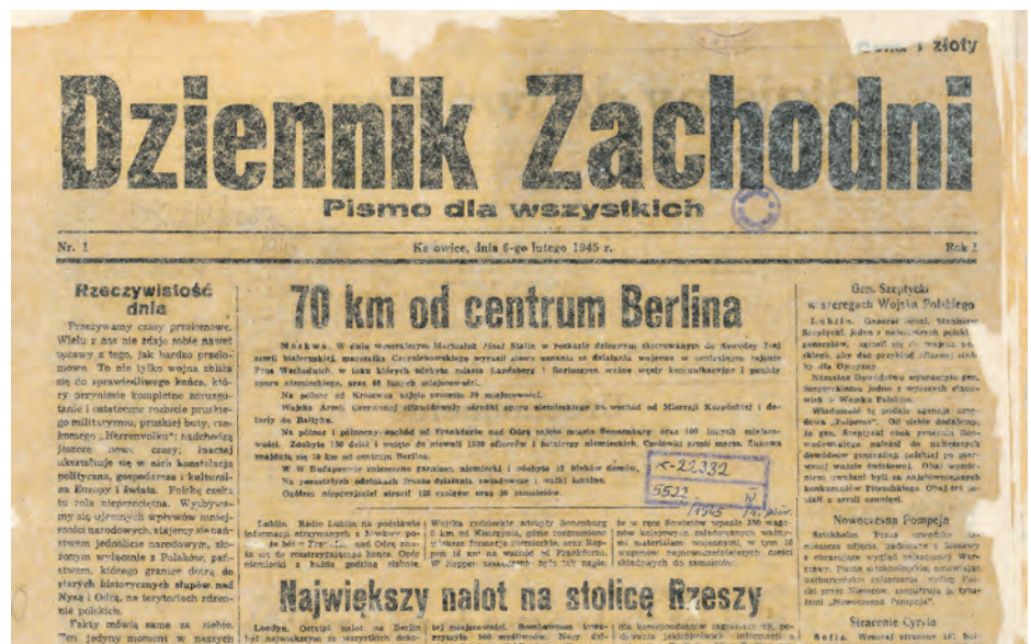
Pierwszy numer "Dziennika Zachodniego"