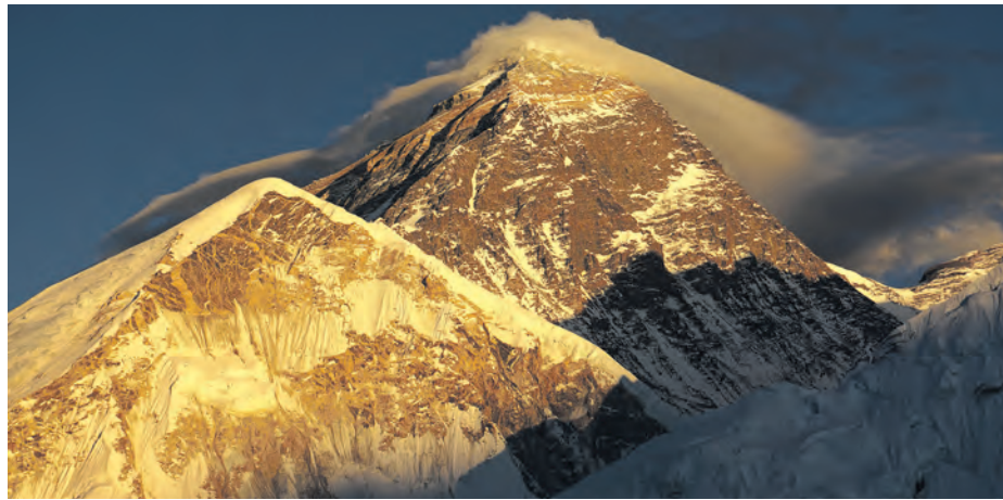
Mount Everest 8848 m. n. p. m.

I to właśnie dla uczczenia 40. rocznicy zimowego Everestu, a może nawet całości dokonani Łodowych Wojowników, jak zwykło się nazywać polskich himalaistów, stowarzyszenie Silesia Adventure Sport organizuje Himalajską Grę Terenową. Gra odbędzie się na terenie dzielnicy Murcki oraz