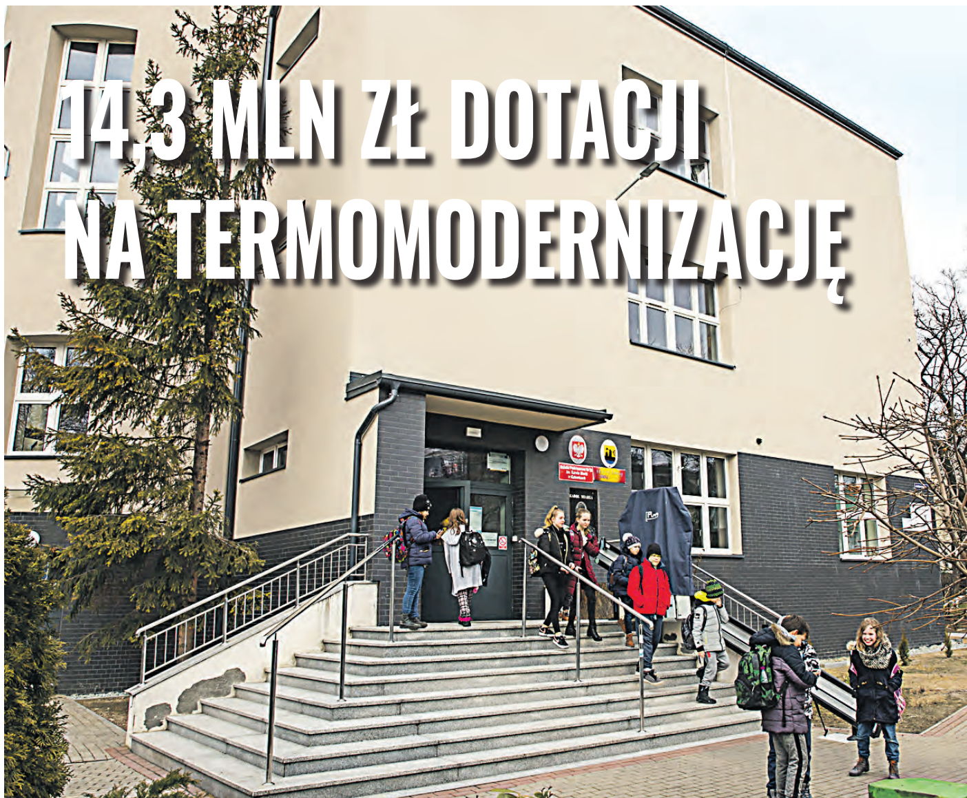
Termomodernizacja z przyłączeniem do sieci gazowej Szkoły Podstawowej nr 28 przy ul. Gen. Jankego 160 w Katowicach.

NR 2 (137) | Luty 2020 r. | Bezpłatny informator miejski | tel. 32 259 39 88 | redakcja@katowice.eu | ISSN 1899-9530