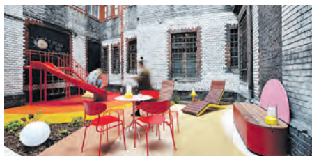
Podwórko przy ul. Dyrekcyjnej zmienione w programie PLAC NA GLANC

– Tematem naszych warsztatów jest Revival. Temat ten chcemy przedstawiać jako szeroko pojęte przywracanie do życia przestrzeni miejskich, a nasze pierwsze pomysły wzorowaliśmy właśnie na działaniach prowadzonych przez Miasto Ogrodów. Ich