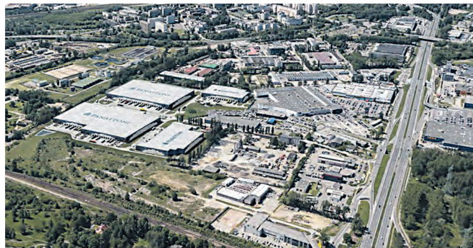
City Logistics Katowice

Teren, który kupiła firma, od lat jest nieużytkowany. Zadaniem spółki będzie oczyszczenie nieruchomości poprzez remediację ok. 2 tys. m 3 gleby. Koszt tylko tego