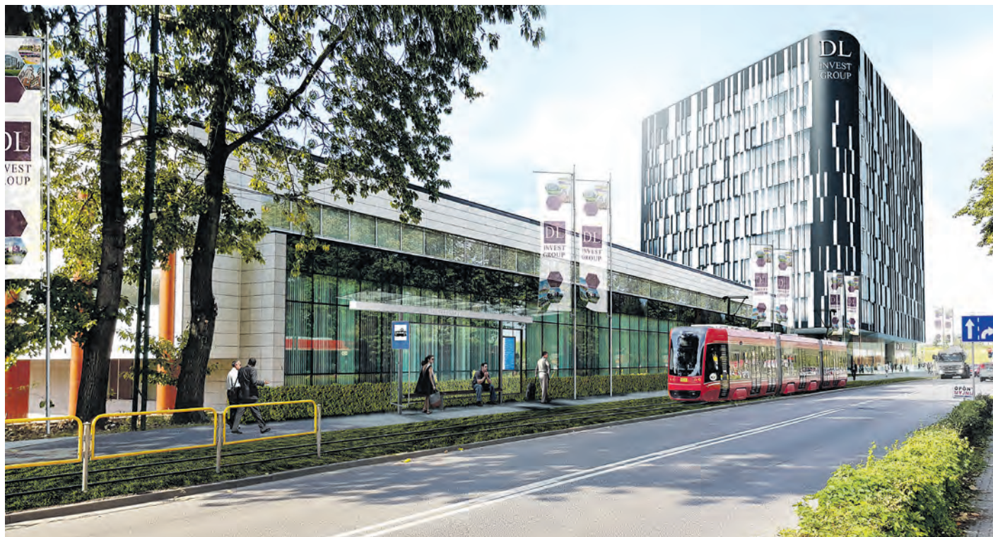
DL Center Point Katowice Korfantego

Międzynarodowa firma z branży logistycznej zainwestuje w Szopienicach-Burowcu. Dzięki budowie centrum magazynowo-biurowego rekultywacji poddany zostanie teren poprzemysłowy, a miasto zyska dodatkowe środki z tytułu podatków.