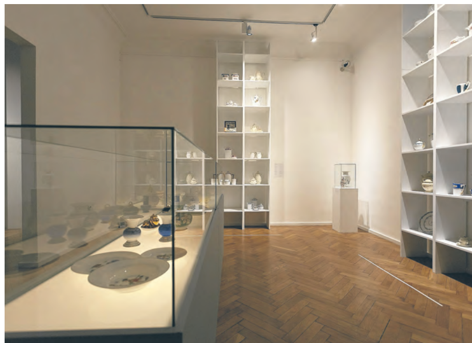
Wystawa „Z fabryki na salony”