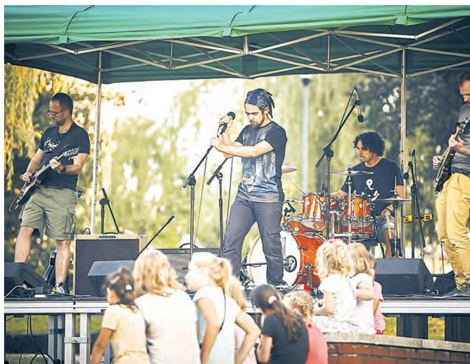
Dzielnic brzmi dobrze - koncert w Szopienicach

Żeby dojść do finałowej piątki, trzeba przejść eliminacji i je wygrać. Do 20 marca Miasto Ogrodów czeka na zgłoszenia amatorskich zespołów, czyli takich, które nie mają podpisanego kontraktu z żadną wytwórnią i są związane z którąś z katowickich dzielnic.