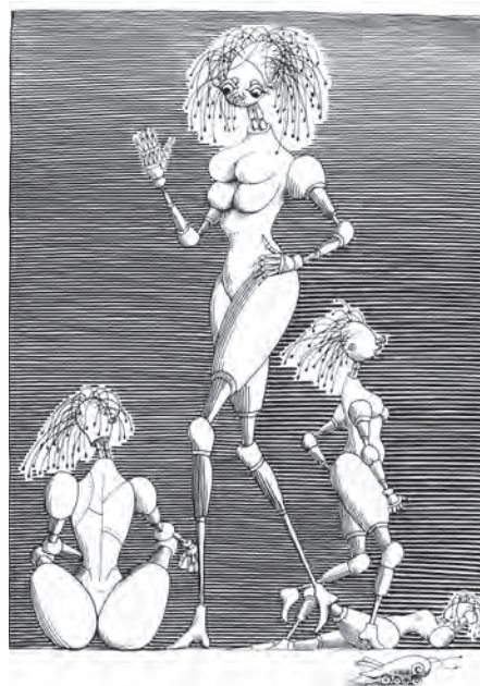
Stanisław Lem, CYBERIADA , Wydawnictwo Literackie, 1972 r.

swoisty nowy wymiar, z którym mamy do czynienia, patrząc na te wszystkie z pozoru „techniczne”, a w istocie „metaforyczne” człekozwierzomachiny. Swoboda kreski, polot i poczucie humoru – to nie starzeje się nigdy. To znajduje odbiorcę zawsze.