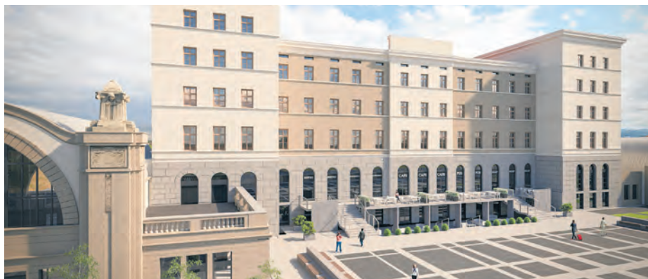
Stary Dworzec – Dworcowa 8, wizualizacja

W najbliższym czasie powinna także rozpocząć się modernizacja największego, 6-kondygnacyjnego gmachu przy ul. Dworcowej 8 o powierzchni 4,6 tys. m 2 . Opal Maksimum ogłosił już przetarg, w ramach którego wyłoni wykonawcę prac budowlanych. Ich efektem będzie całkowita przemiana budynku. Wyłoniona firma wykona remont dachu, nowe stropy, szyby windowe, instalacje, stolarkę okienną i drzwiową, a także prace