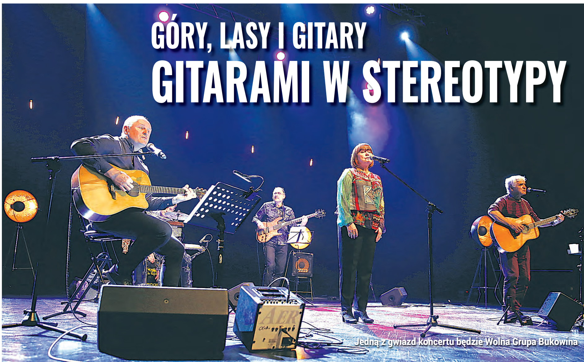
Jedną z gwiazd koncertu będzie Wolna Grupa Bukowina