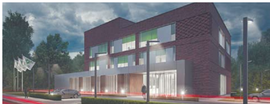
Wizualizacja nowej siedziby UDT