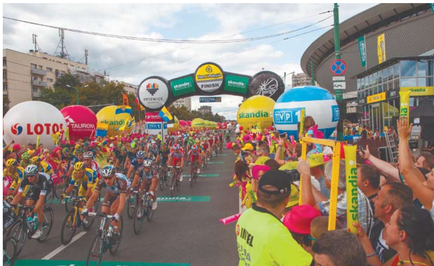
Również w tym roku Katowice znajdują się na trasie wyścigu