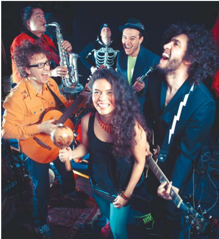
La Chiva Gantiva

Lato to najlepszy czas na podróż. Nawet te bez ruszania się z Katowic. Dzięki Festiwalowi Muzyki Świata Ogrody Dźwięków to możliwe. Początek: 19 czerwca w podcieniach Centrum Kultury Katowice.