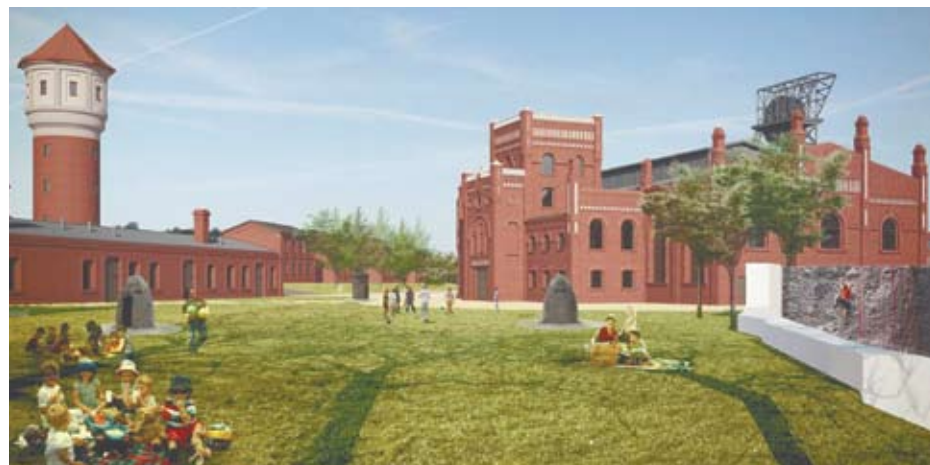
Wizualizacja Nowego Muzeum Śląskiego