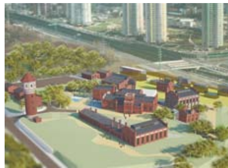
Wizualizacja Nowego Muzeum Śląskiego

W okolicach wieży ciśnień, która zarazem będzie pełnić funkcję latarni muzeum, ma powstać łąka artystów i śląski ogród. Wnętrze wieży posłuży do ekspozycji przekrojów geologicznych ziem Śląska. – Łaźnia Gwarek byłaby miejscem prezentacji śląskich projektantów oraz dizajnu europejskiego. Natomiast obok łaźni głównej, którą zaadaptujemy na potrzeby ekspozycyjne i administracyjno-biurowe dla działów archeologii, etnografii i historii, po-