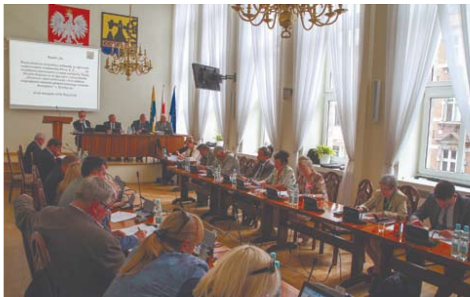
Sesja Rady Miasta Katowice

Deficyt budżetowy, czyli wydatki nieznajdujące pokrycia w planowanych dochodach, w wysokości 479 mln zł, sfinansowany