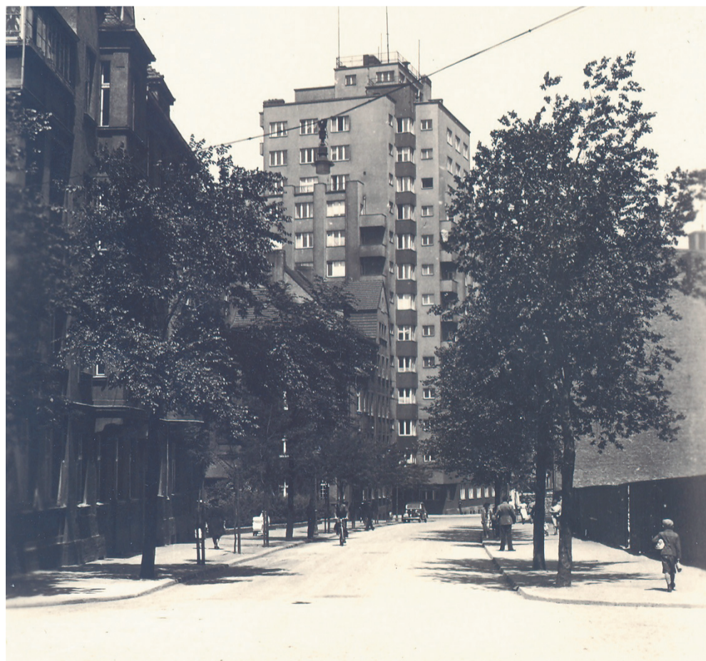
Drapacz chmur, ul. Żwirki i Wigury, 1939 r.