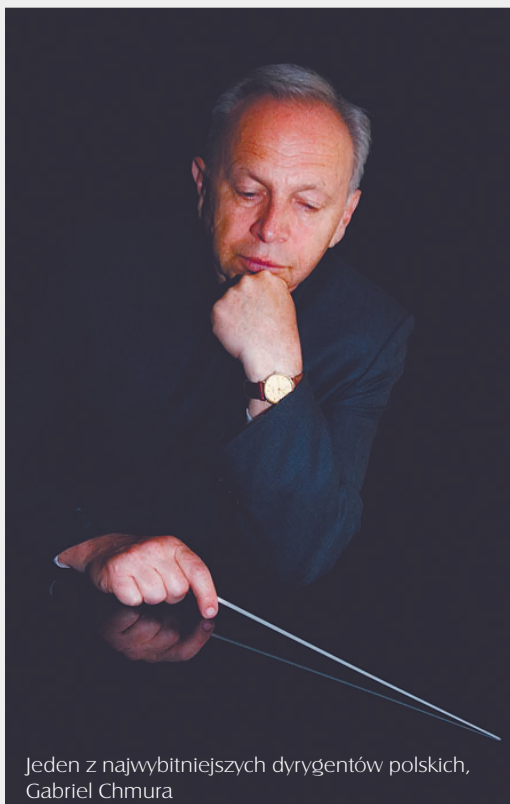
Jeden z najwybitniejszych dyrygentów polskich, Gabriel Chmura

Melomani mają w listopadowym programie Filharmonii Śląskiej w czym wybierać.