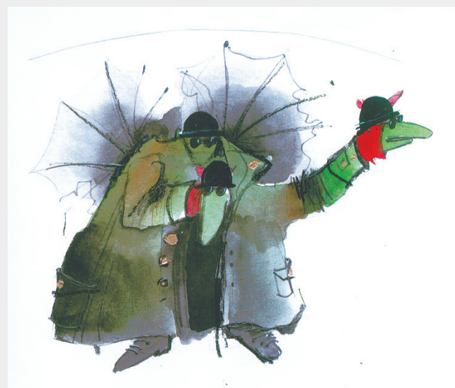
Smok, proj. scenograficzny