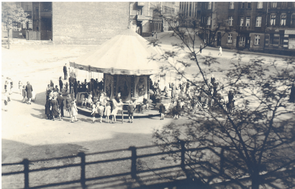
Obecny plac Oddziałów Młodzieży Powstańczej; widok z okna mieszkania na pierwszym piętrze przy dawnej Victoriastrasse 5a, 1942 r.